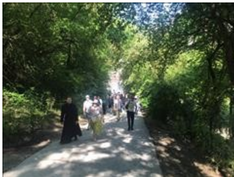
Паломническая поездка 1 фото 2 Паломническая поездка 1 фото 2