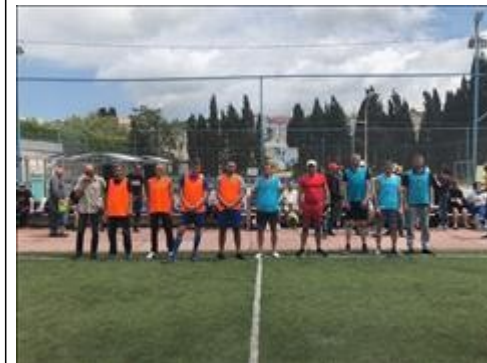
турнир по футболу фото 7 турнир по футболу фото 7