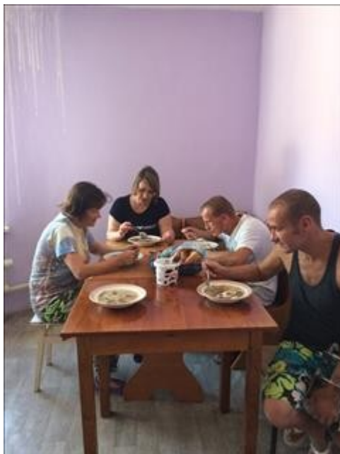
Кулинарный мастер класс фото 1 Кулинарный мастер класс фото 1

Мероприятие проведено 6 кулинарных мастер-классов (по два в каждом доме реабилитации). Каждое мероприятие посетило не менее 5 воспитанников. Итого не менее 15 чел.