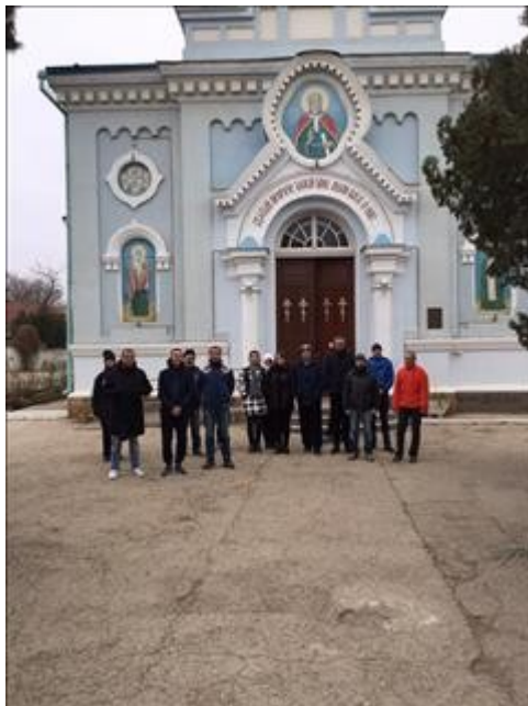
Паломническая поездка 1 фото 3 Паломническая поездка 1 фото 3