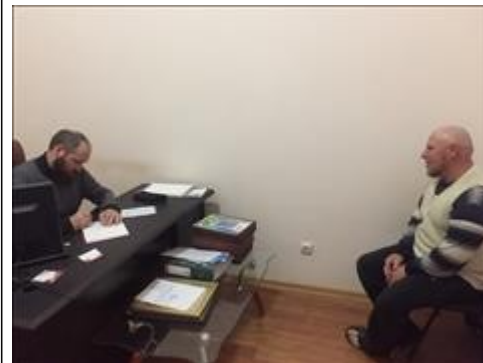
Юридическая консультация фото 2 Юридическая консультация фото 2