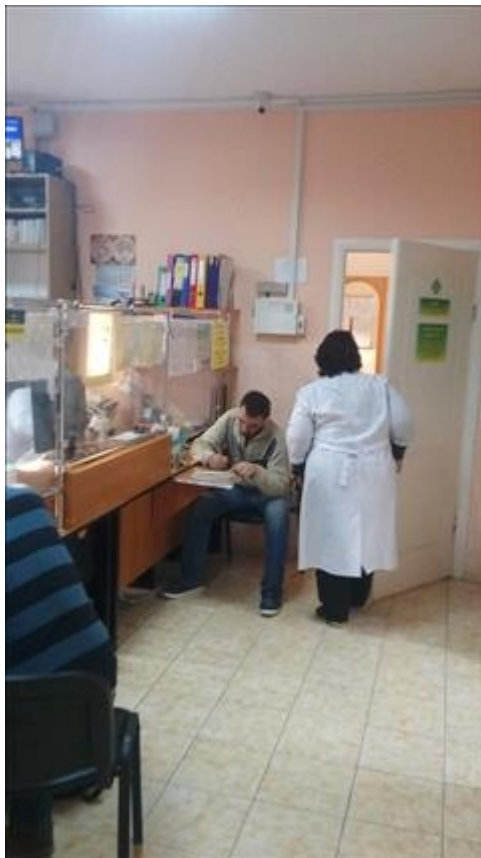
Медосмотр фото 3 Медосмотр фото 3