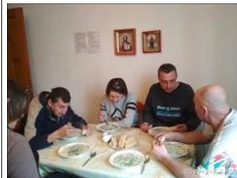
Кулинарный мастер класс фото 6 Кулинарный мастер класс фото 6