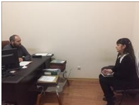
Юридическая консультация фото 1 Юридическая консультация фото 1