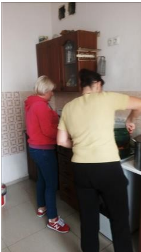
Кулинарный мастер класс фото 3 Кулинарный мастер класс фото 3