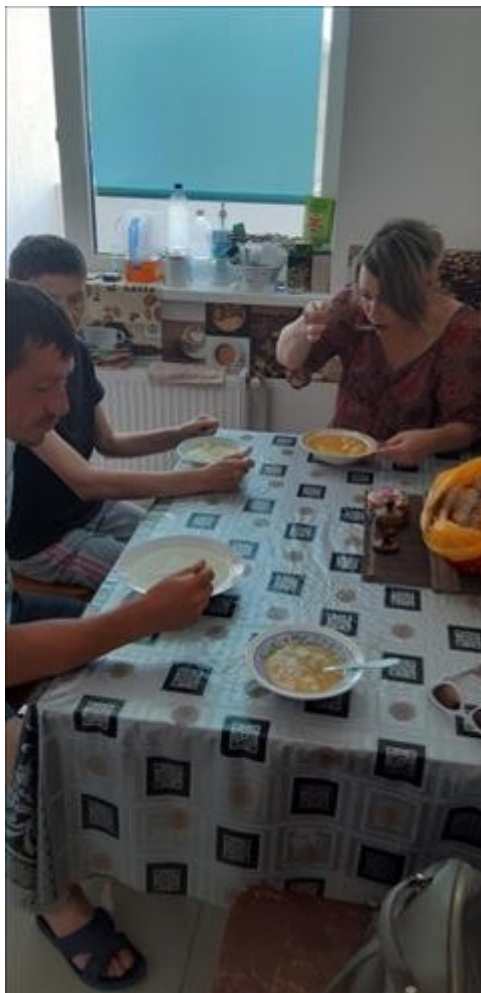
Кулинарный мастер класс фото 7 Кулинарный мастер класс фото 7

Мероприятие: оказана безвозмездная юридическая помощь не менее чем 12 воспитанникам.