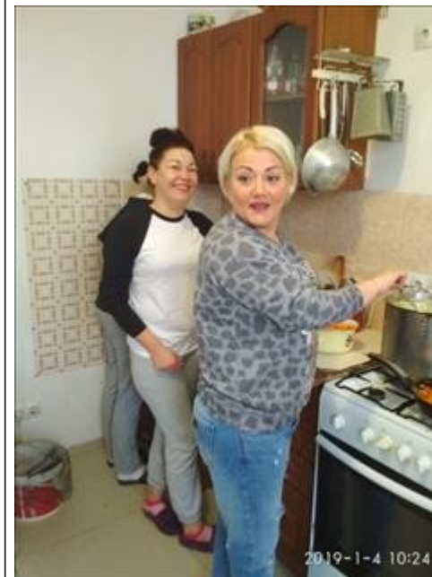
Кулинарный мастер класс фото 2 Кулинарный мастер класс фото 2