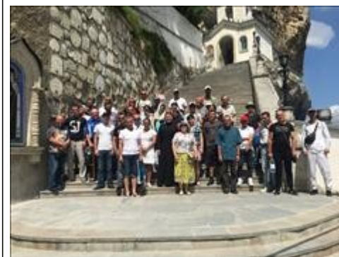
Паломническая поездка 2 фото 1 Паломническая поездка 1 фото 1