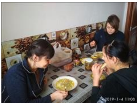
Кулинарный мастер класс фото 5 Кулинарный мастер класс фото 5