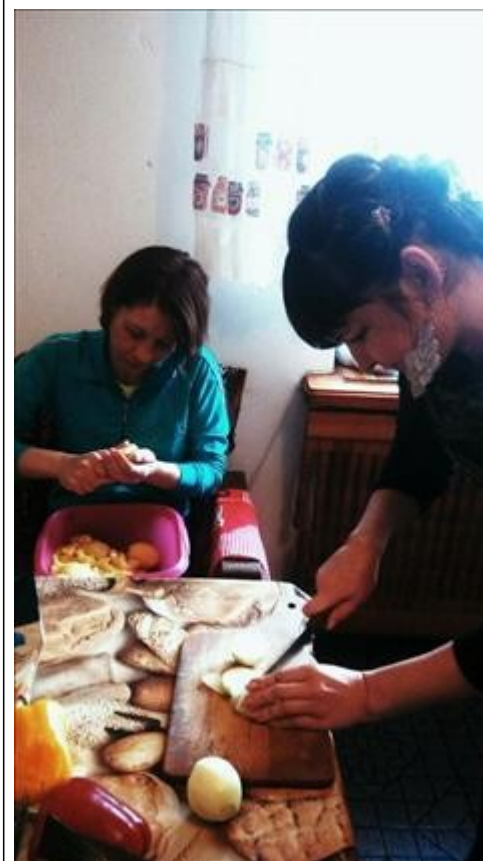
Кулинарный мастер класс фото 8 Кулинарный мастер класс фото 8