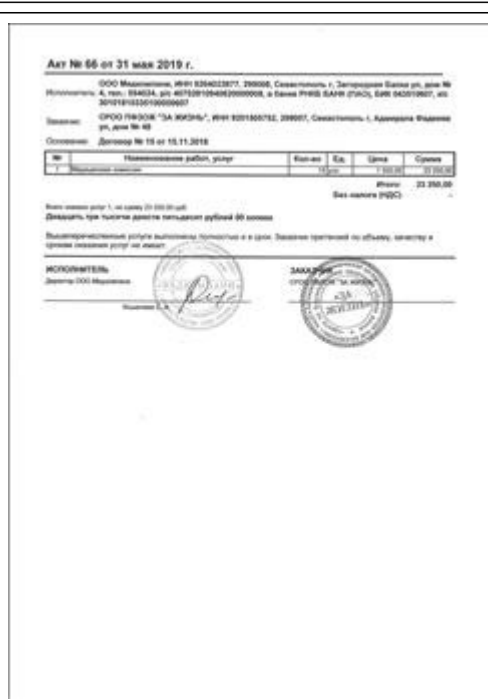
Медосмотр фото 7 Медосмотр фото 7