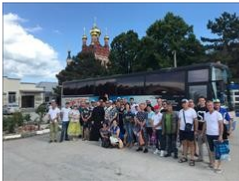
Паломническая поездка 1 фото 4 Паломническая поездка 1 фото 4