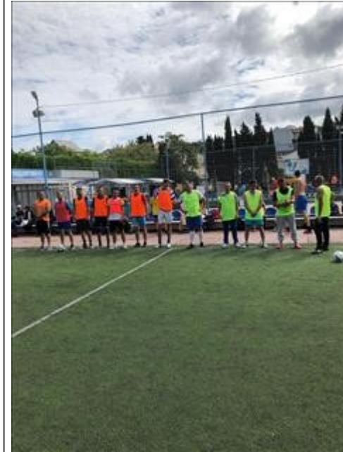
Турнир по футболу фото 4 Турнир по футболу фото 4