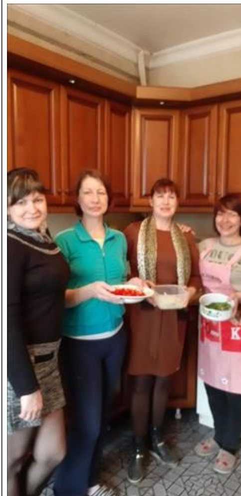
Кулинарный мастер класс фото 4 Кулинарный мастер класс фото 4