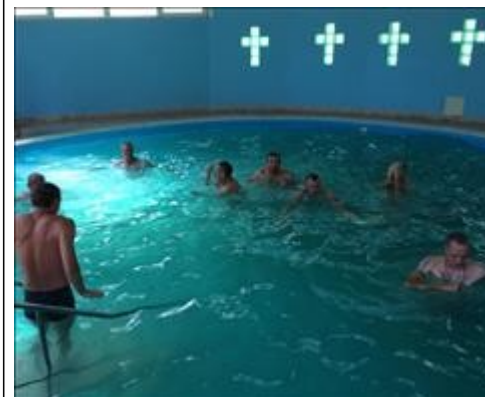
Паломническая поездка 1 фото 3 Паломническая поездка 1 фото 3