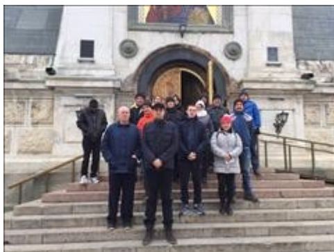
Паломническая поездка 1 фото 1 Паломническая поездка 1 фото 1

Мероприятие проведено две паломнические поездки по святым местам Крыма для воспитанников центра. Участие в каждой поездке приняли 50 чел.