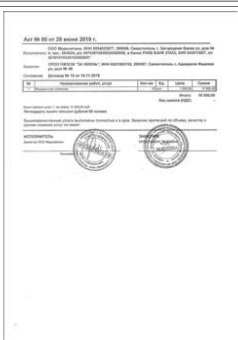
Медосмотр фото 8 Медосмотр фото 8

Электронные версии материалов (бюллетеней, брошюр, буклетов, газет, докладов, журналов, книг, презентаций, сборников и иных), созданных с использованием гранта в отчетном периоде (при условии, что такие материалы не содержатся в материалах, указанных в подпункте 5 настоящего пункта)