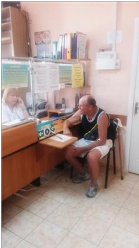
Медосмотр фото 1 Медосмотр фото 1