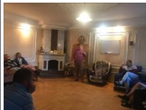
Юридическая консультация фото 4 Юридическая консультация фото 4

Мероприятие проведено медицинское обследование 45 воспитанников. Оказание экстренной медицинской помощи не понадобилось. Проведено 5 консультаций узких специалистов.