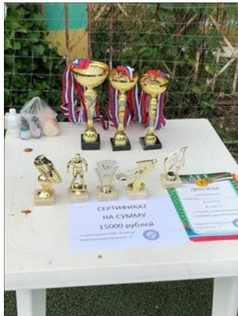
Турнир по футболу фото 5 Турнир по футболу фото 5