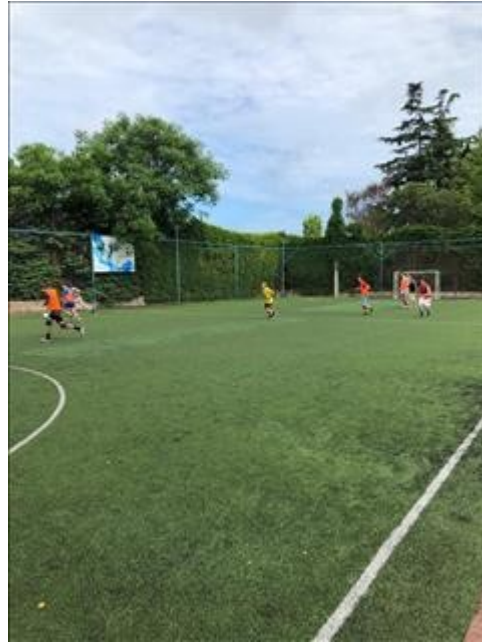
Турнир по футболу фото 3 Турнир по футболу фото 3