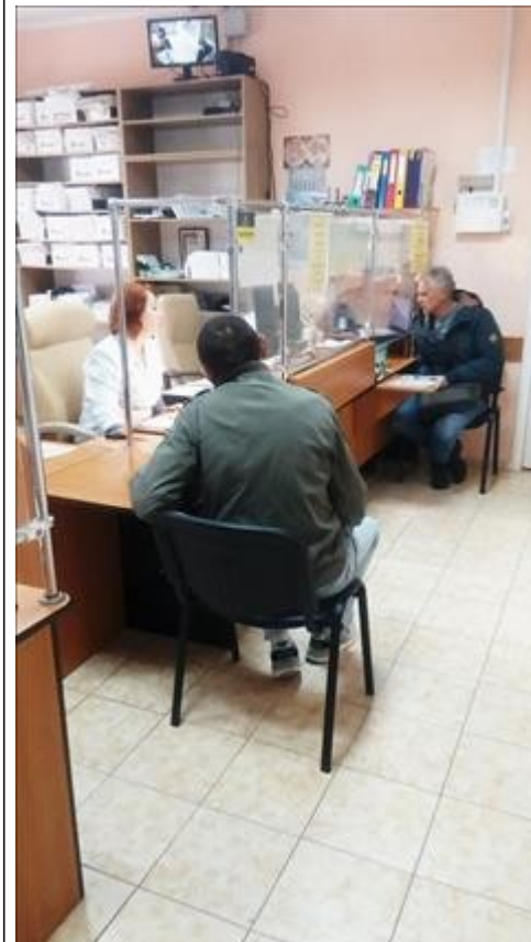
Медосмотр фото 2 Медосмотр фото 2