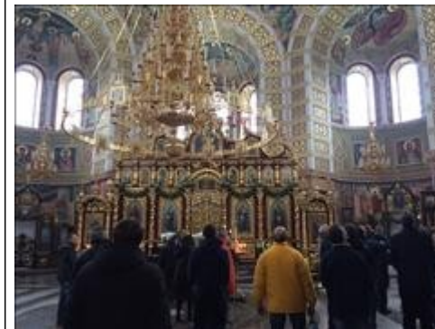
Паломническая поездка 1 фото 4 Паломническая поездка 1 фото 4

Мероприятие проведено 6 кулинарных мастер-классов (по два в каждом доме реабилитации). Каждое мероприятие посетило не менее 5 воспитанников. Итого не менее 15 чел.