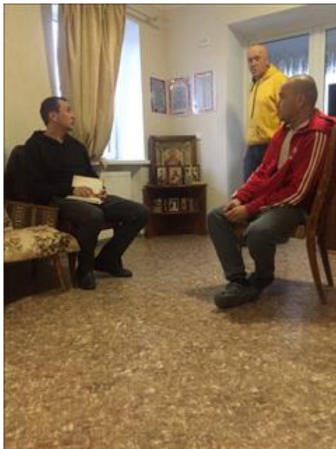
Юридическая помощь фото 3 Юридическая помощь фото 3