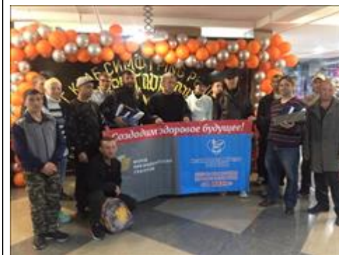
Спортивные мероприятия фото 6 Спортивные мероприятия фото 6