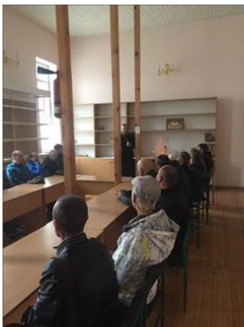
Встреча с духовным наставником фото 3 Встреча с духовным наставником фото 3