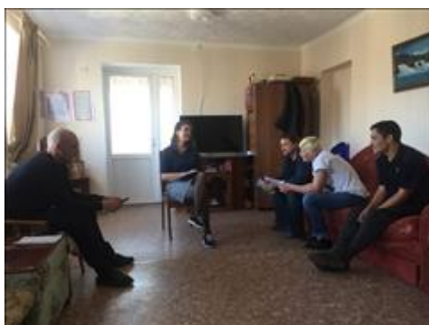
Занятия с психологом фото 7 Занятия с психологом фото 7