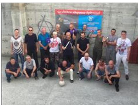
Спортивные мероприятия фото 1 Спортивные мероприятия фото 1