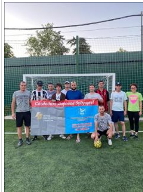
Спортивные мероприятия фото 8 Спортивные мероприятия фото 8

Мероприятие: Оказаны медицинские услуги не менее 16 воспитанникам