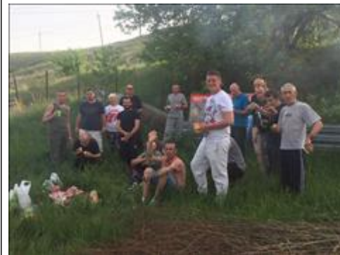
Культурные мероприятия фото 8 Культурные мероприятия фото 8