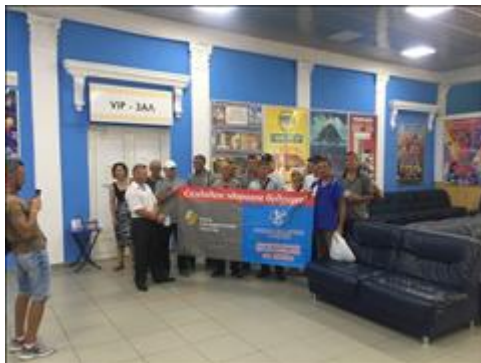
Культурные мероприятия фото 7 Культурные мероприятия фото 7