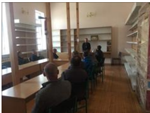
Встреча с духовным наставником фото 7 Встреча с духовным наставником фото 7