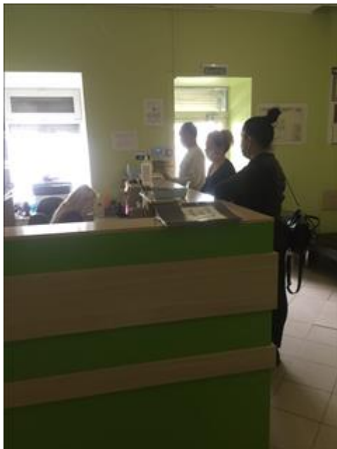
Оказание медицинской помощи фото 1 Оказание медицинской помощи фото 1