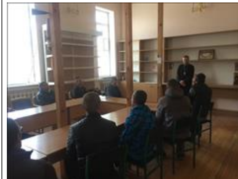
Встреча с духовным наставником фото 2 Встреча с духовным наставником фото 2