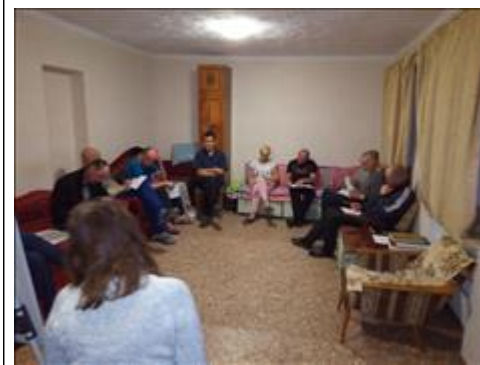
Занятия с психологом фото 2 Занятия с психологом фото 2