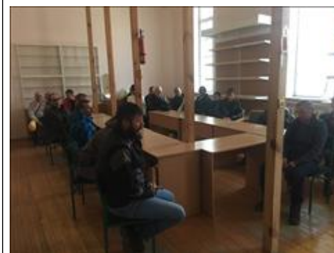
Встреча с духовным наставником фото 4 Встреча с духовным наставником фото 4