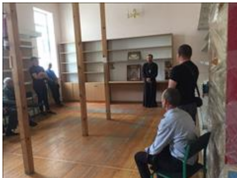
Встреча с духовным наставником фото 1 Встреча с духовным наставником фото 1