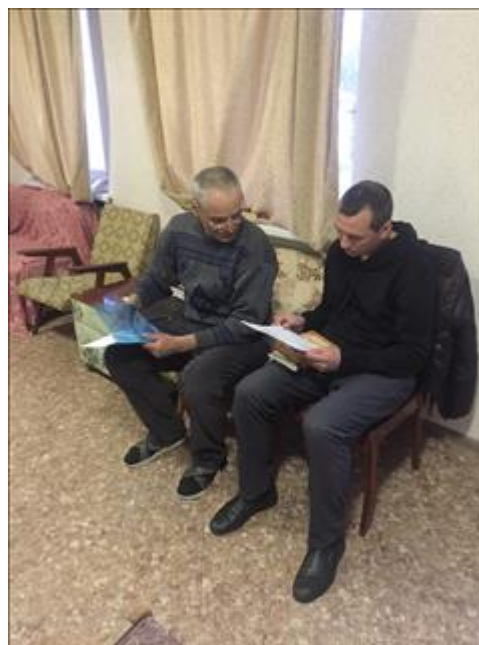
Юридическая помощь фото 1 Юридическая помощь фото 1

Информация, указанная Вами в данном разделе отчета, будет доступна для посетителей сайта оценка.гранты.рф (в том числе для представителей СМИ).