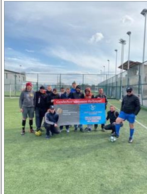
Спортивные мероприятия фото 4 Спортивные мероприятия фото 4