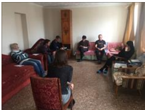
Занятия с психологом фото 5 Занятия с психологом фото 5