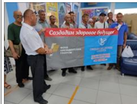
Культурные мероприятия фото 6 Культурные мероприятия фото 6