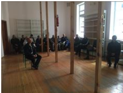
Встреча с духовным наставником фото 5 Встреча с духовным наставником фото 5