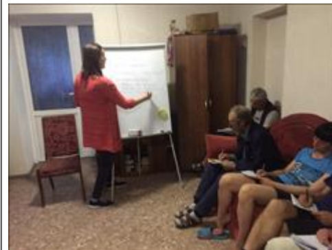
Занятия с психологом фото 4 Занятия с психологом фото 4