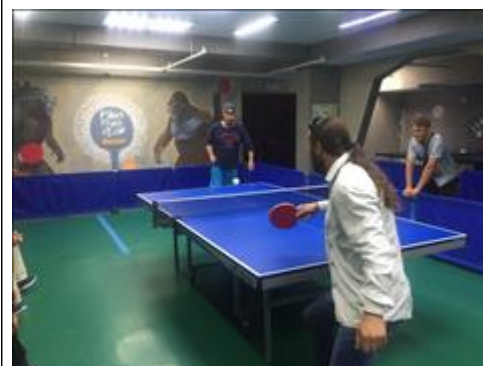
Спортивные мероприятия фото 2 Спортивные мероприятия фото 2