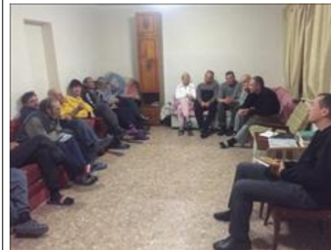
Юридическая помощь фото 4 Юридическая помощь фото 4

Мероприятие: Проведено не менее 43 занятия воспитанников с психологом, не менее 21 занятий с духовными наставниками, не менее 5 культурных и не менее 5 спортивных мероприятия