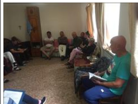
Занятия с психологом фото 8 Занятия с психологом фото 8