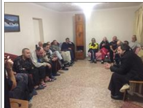
Встреча с духовным наставником фото 8 Встреча с духовным наставником фото 8