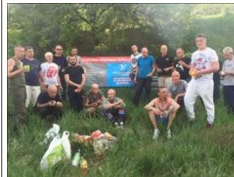
Культурные мероприятия фото 4 Культурные мероприятия фото 4