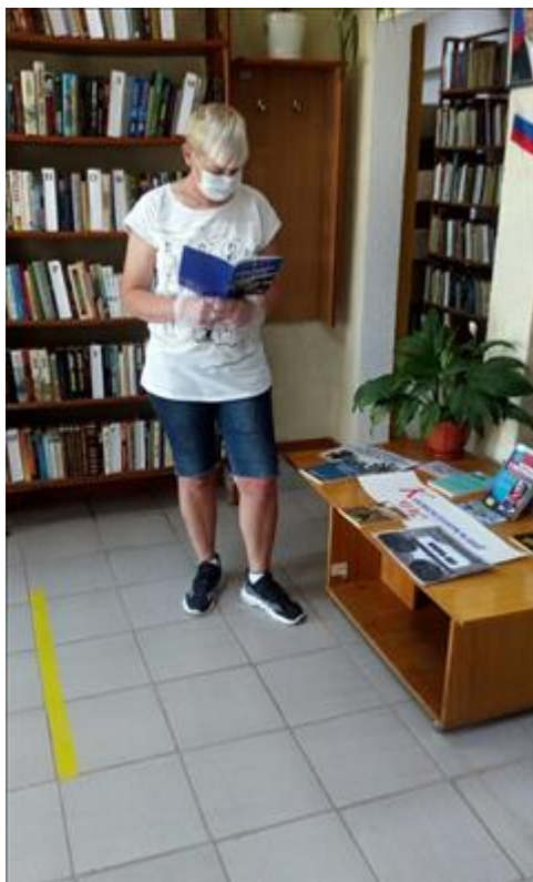
Культурные мероприятия фото 1 Культурные мероприятия фото 1