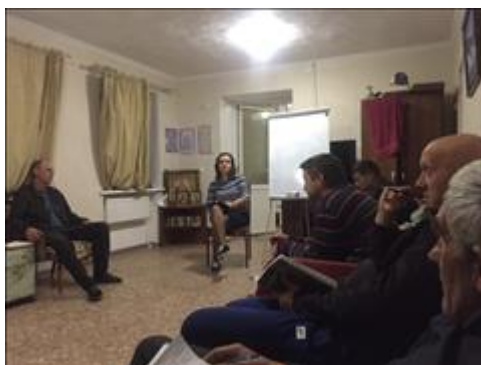
Занятия с психологом фото 1 Занятия с психологом фото 1

Мероприятие: Проведено не менее 43 занятия воспитанников с психологом, не менее 21 занятий с духовными наставниками, не менее 5 культурных и не менее 5 спортивных мероприятия