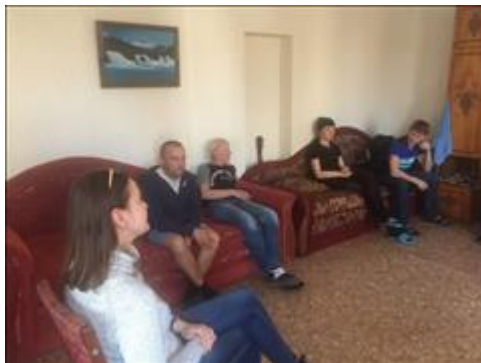
Занятия с психологом фото 3 Занятия с психологом фото 3