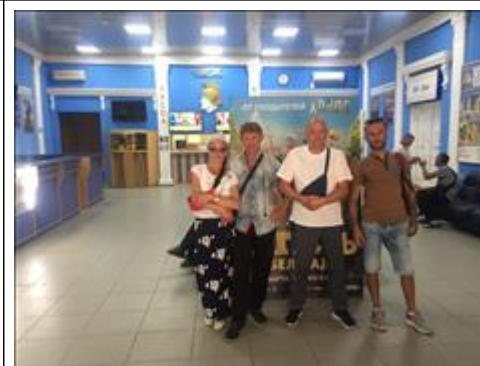
Культурные мероприятия фото 2 Культурные мероприятия фото 2