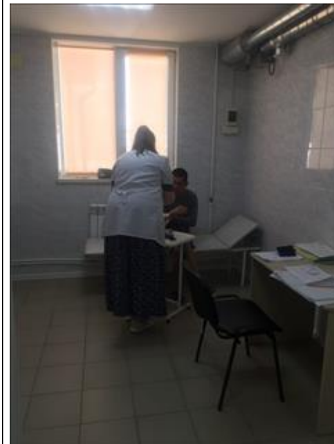
Оказание медицинской помощи фото 2 Оказание медицинской помощи фото 2