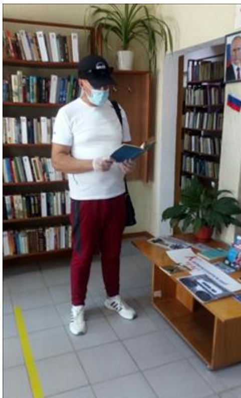
Культурные мероприятия фото 3 Культурные мероприятия фото 3