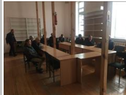
Встреча с духовным наставником фото 6 Встреча с духовным наставником фото 6