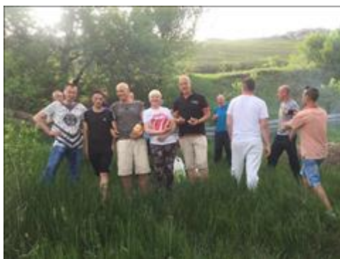
Культурные мероприятия фото 5 Культурные мероприятия фото 5