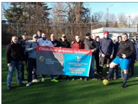
Спортивные мероприятия фото 7 Спортивные мероприятия фото 7