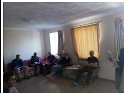
Занятия с психологом фото 6 Занятия с психологом фото 6