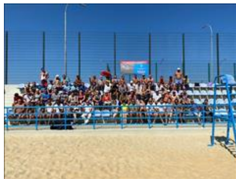
Спортивные мероприятия фото 5 Спортивные мероприятия фото 5