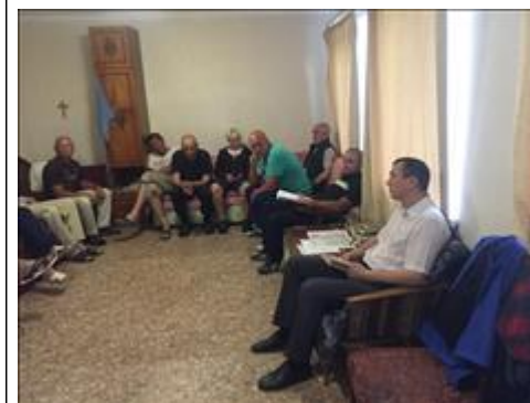
Юридическая помощь фото 2 Юридическая помощь фото 2