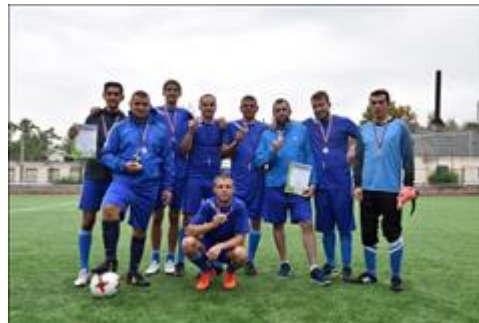
Внутренние мероприятия фото 3 Внутренние мероприятия фото 3