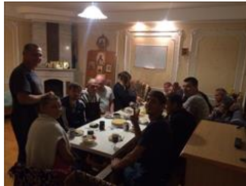
Внутренние мероприятия фото 1 Внутренние мероприятия фото 1