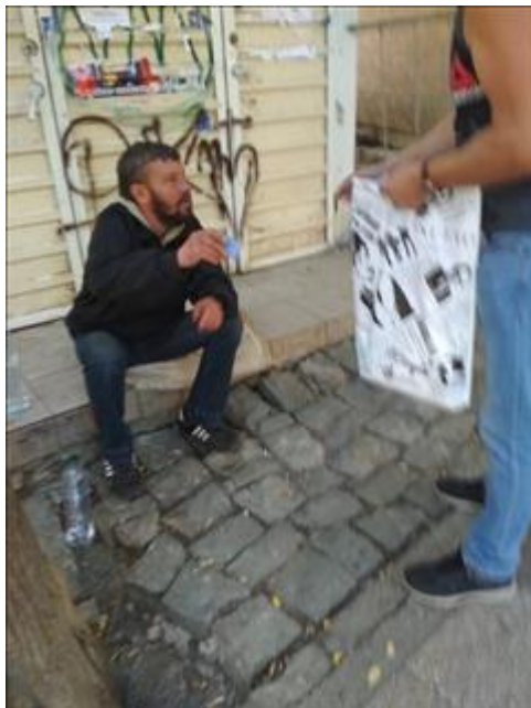
Социальные рейды фото 1 Социальные рейды фото 1