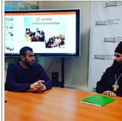
Круглый стол фото 2 Круглый стол фото 2