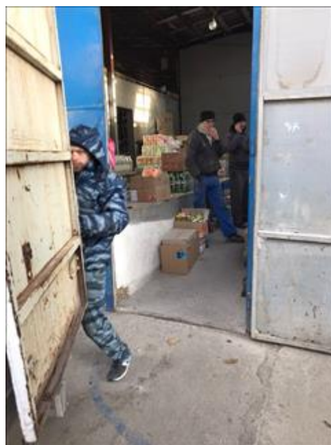
Закупка продуктов фото 1 Закупка продуктов фото 1