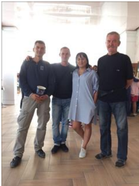
Культурные мероприятия фото 1 Культурные мероприятия фото 1