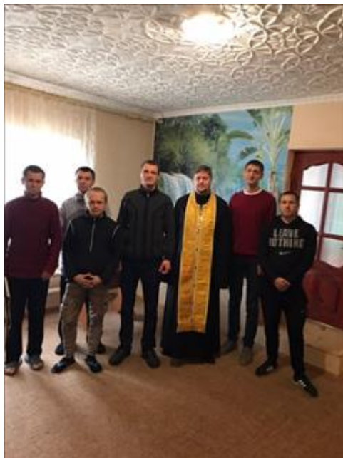
Общение с духовными наставниками фото 3 Общение с духовными наставниками фото 3