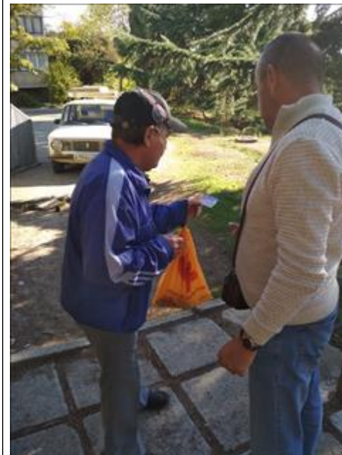
Социальные рейды фото 2 Социальные рейды фото 2