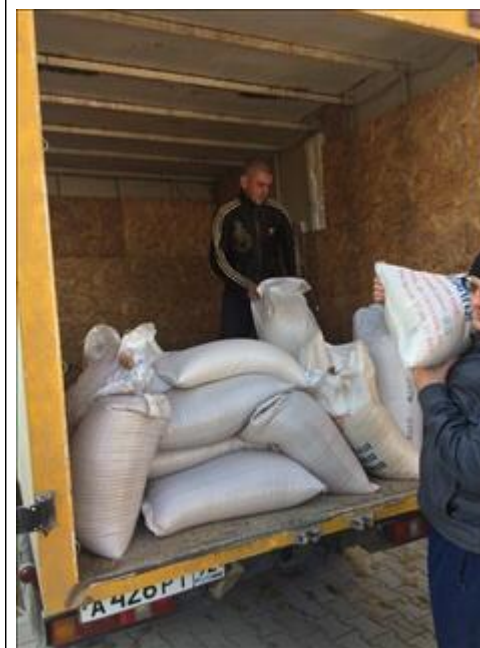
Закупка продуктов фото 2 Закупка продуктов фото 2