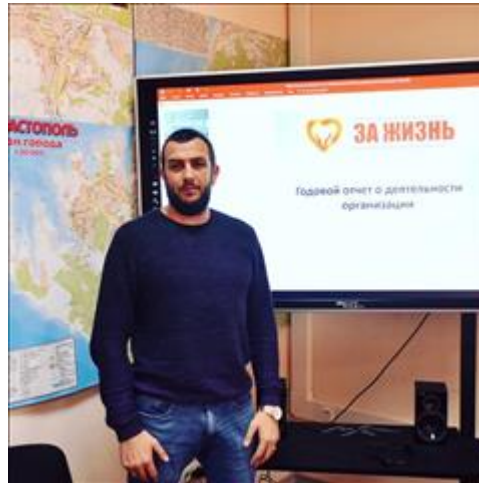
Круглый стол фото 1 Круглый стол фото 1

Мероприятие: Проведено открытое отчетное мероприятие в формате "круглого стола"