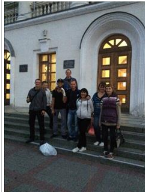
Культурные мероприятия фото 2 Культурные мероприятия фото 2