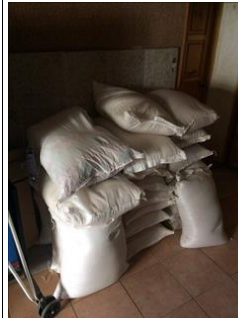
Закупка продуктов фото 4 Закупка продуктов фото 4

Мероприятие: Работа психолога (регулярные индивидуальные и групповые занятия)