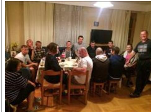
Внутренние мероприятия фото 2 Внутренние мероприятия фото 2