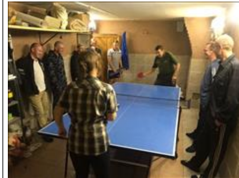
Внутренние мероприятия фото 4 Внутренние мероприятия фото 4