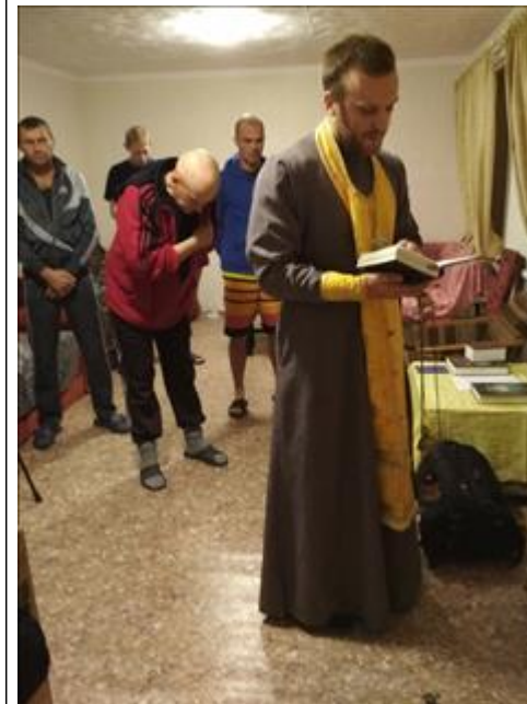
Общение с духовными наставниками фото 4 Общение с духовными наставниками фото 4

Мероприятие: Посещение культурных мероприятий