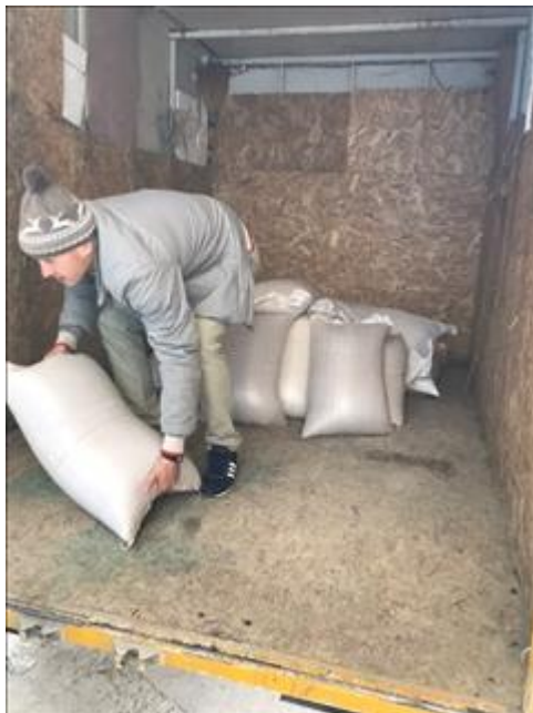
Закупка продуктов фото 3 Закупка продуктов фото 3